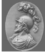
Ligue Henri IV